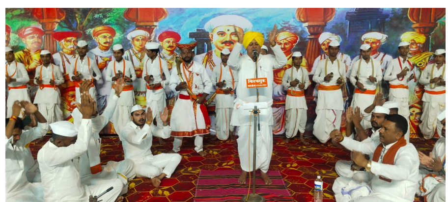
पारनेर

श्रीसंत तुकाराम महाराज विजोत्सवा निमित्त पारनेर तालुक्यातील वडझिरे येथील अखंड हरीनाम साप्ताहास ५० वर्ष पूर्ण झाल्यामुळे, सुवर्ण महोत्सवी अखंड हरीनाम सप्ताहाचे आयोजन करण्यात आले होते. या भव्य