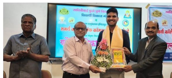
जुन्नर तालुका : (समर्थ गांवकरी)

सावित्रीबाई फुले पुणे विद्यापीठ, पुणे विद्यार्थी विकास मंडळ, समर्थ रुशल एज्युकेशनल इन्स्टिट्यूट संचलित समर्थ कॉलेज ऑफ कॉम्प्युटर सायन्स, बेल्हे यांच्या संयुक्त विद्यमाने कौशल्य विकास कार्यशाळेचे आयोजन समर्थ शैक्षणिक संकुल बेल्हे येथे करण्यात आले होते. या कार्यशाळेसाठी विविध महाविद्यालयातील १०० विद्यार्थी सहभागी झाले होते. कार्यक्रमाच्या प्रारंभी मान्यवरांच्या हस्ते दीपप्रज्वलन करून उद्घाटन