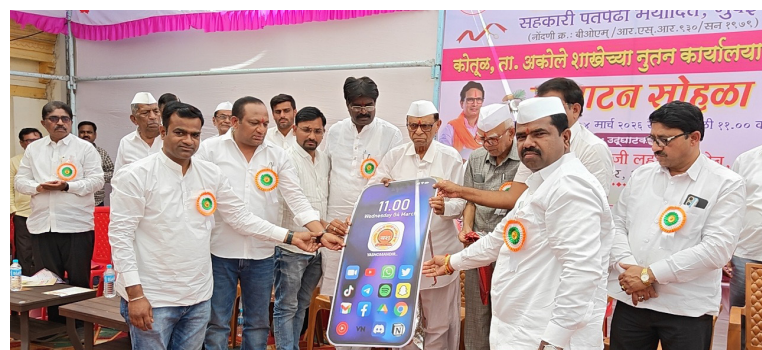
कोतुळ : (समर्थ गांवकरी)