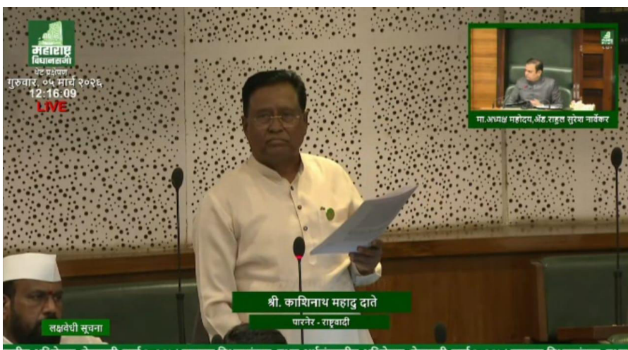
जिल्हा अधिवेशन (फेब्रुवारी, मार्च २०२६)। महाराष्ट्र विधानसभेकडून पथक अर्थसंकल्पीय अधिवेशन (फेब्रुवारी, मार्च २०२६)। महाराष्ट्र विधानसभेकडून पथक