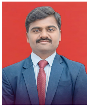
कर्जत : (समर्थ गांवकरी)

कठोर परिश्रम आणि सातत्यपूर्ण अभ्यासाच्या जोरावर गाठले यशाचे शिखर !