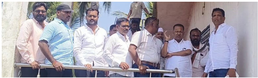
जामखेड : (समर्थ गांवकरी)