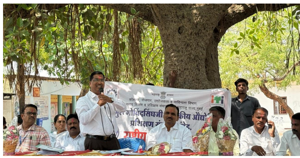
नांदेड : (समर्थ गांवकरी)