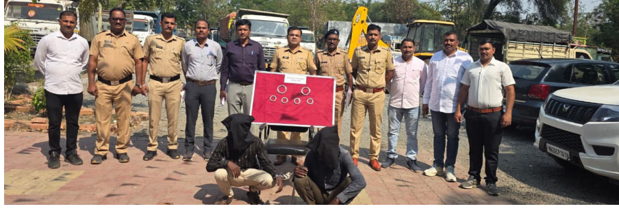
नांदेड