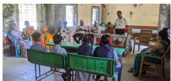
जुन्नर तालुका : (समर्थ गांवकरी)