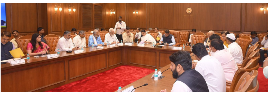
पारनेर