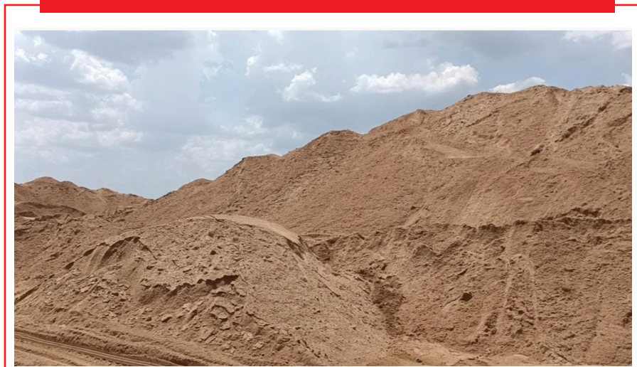
नांदेड जिल्हा : तालुक्यातील सगरोळी येथील शासकीय रेंती डेपो क्रमांक ०१ मधील शिल्क वाळू साठ्याचा लिलाव प्रक्रिया प्रशासकीय कारणास्तव रद्द करण्यात आली आहे. या डेपोसाठी झालेला आधीचा लिलाव रद्द करून आता येत्या २७ मार्च २०२६ रोजी दुपारी १२ वाजता उपविभागीय अधिकारी कार्यालय, बिलोली येथे फेर लिलाव आयोजित करण्यात आला आहे.

गावांमध्ये बांधकामासाठी अन-आपती प्रमाणपत्र संदर्भातील परिपत्रकांमधील विरोधाभासांमुळे निर्माण झालेल्या गोंधळाचा मुद्दा त्यांनी मांडला. २०१९ व २०१६ मधील परस्परविरोधी आदेशांमुळे स्थानिक प्रशासन व सैन्य अधिकाऱ्यांमध्ये संभ्रम निर्माण झाला असून, त्याचा फटका नागरिकांना बसत आहे. या पार्श्वभूमीवर एकसंध, स्पष्ट आणि अद्ययावत मार्गदर्शक तत्त्वे तातडीने जारी करण्याची मागणी करण्यात आली.