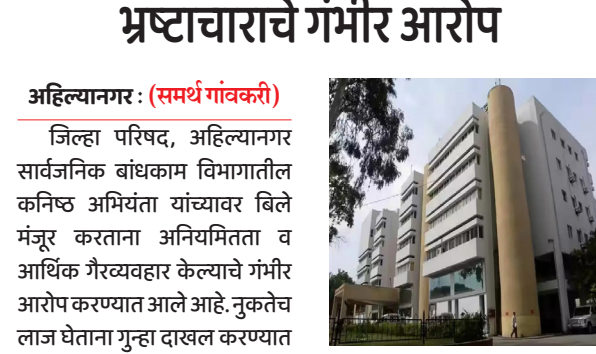
अहिल्यानगर