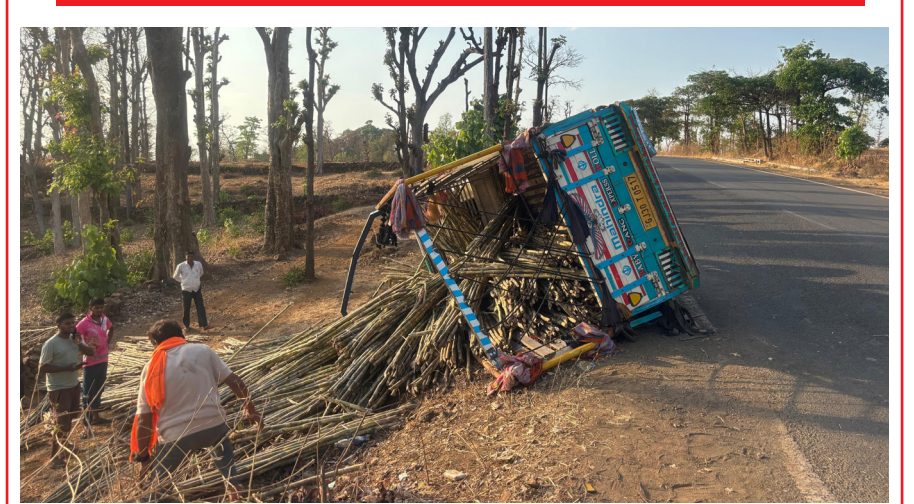
डोंग, गुजरात : मालेगाव घाटात ऊस भरलेली पिकअप गाडी पलटी; गंभीर अपघात प्राप्त माहितीनुसार, आज महाराष्ट्रातील वणी येथून ऊस भरून श्यामगाहाणकडे जात असलेली पिकअप गाडी (क्रमांक: GJ-30-T-0517) डोंग जिल्ह्यातील सापुतारा-श्यामगाहाण राष्ट्रीय महामार्गावर मालेगावजवळ संतोका बोलकिया विद्यालयाजवळ अपघातग्रस्त झाली.

MH-16-DS-0823 ही मधुन नगर ते जामखेड रोड ने जामखेड कडे येत असताना मी बाफना पेट्रोल पंपाकडे टर्न घेत असताना नगर ते जामखेड रोडने एक स्कॉर्पीओ काळ्या रंगाची जीप ही भरधाव वेगात आली व मी टर्न घेत असताना सदर स्कॉर्पीओ गाडीने माझे ड्रायव्हर साईडला जोरीची धडक देवुन निघून गेला. माझे गाडीला धडक बसल्याने दोन एअरबॅग (Airbag) खुलल्या व मला कंबरला व उजवे हातास मार लागला आहे.