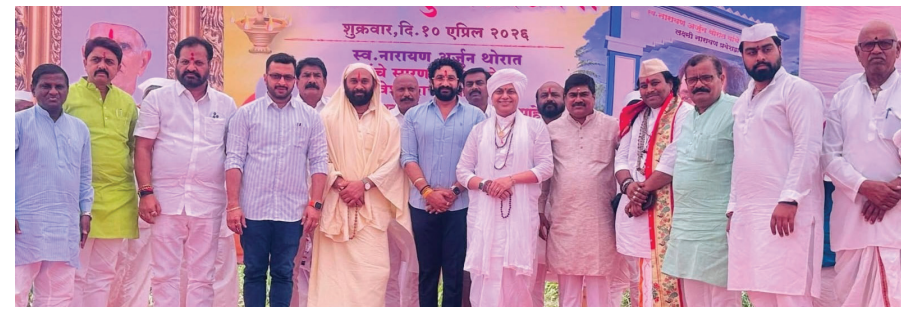
शिवनेरी