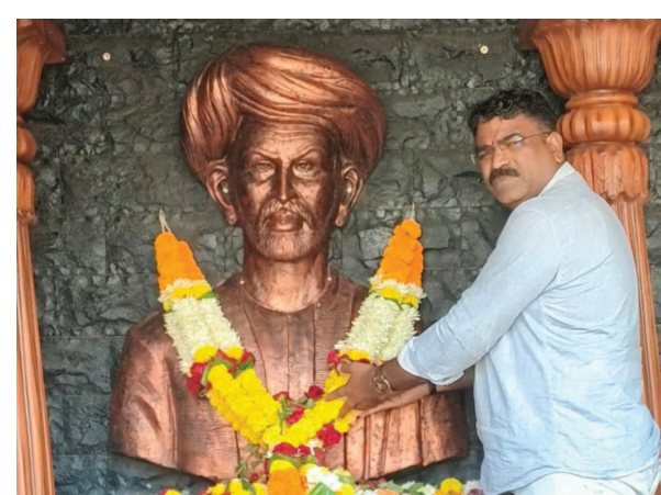
ठाणे

समाजात समता, शिक्षण आणि परिवर्तनाचा संदेश देणाऱ्या महात्मा ज्योतिबा फुले यांच्या जयंतीनिमित्त ठाणे शहरातील एन.के.टी. ट्रस्ट येथे अभिवादन कार्यक्रमाचे आयोजन करण्यात आले.