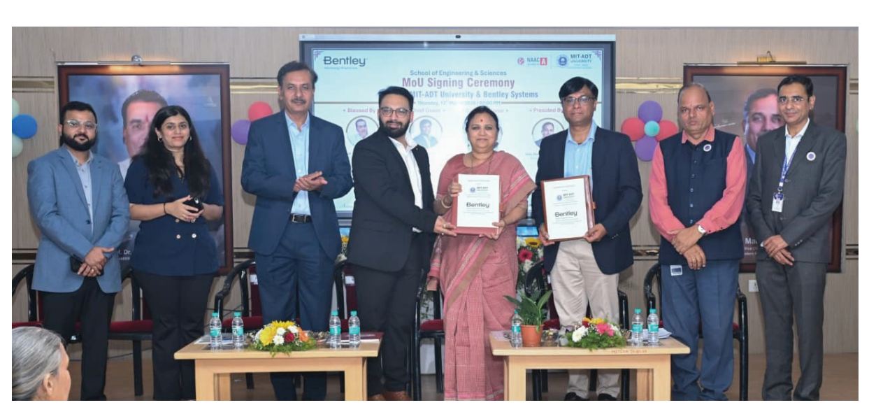
पुणे: (स. गांवकरी)

एमआयटी आर्ट, डिझाईन अँड टेक्नॉलॉजी विद्यापीठ (एमआयटी एडीटी) आणि जागतिक स्तरावरील इन्फ्रास्ट्रक्चर अभियांत्रिकी सॉफ्टवेअर क्षेत्रातील अग्रगण्य कंपनी बेंटली सिस्टिम्स यांच्यात सामंजस्य करार करण्यात आला. याचेवेळी 'इन्फ्रास्ट्रक्चर इनोव्हेशन सेंटर ऑफ एक्सलन्स' या उत्कृष्टता केंद्राचे उद्घाटन करण्यात आले. डिजिटल पायाभूत सुविधा शिक्षणाला चालना देणे आणि उद्योग-संलग्न शिक्षण अधिक सक्षम करणे हा या