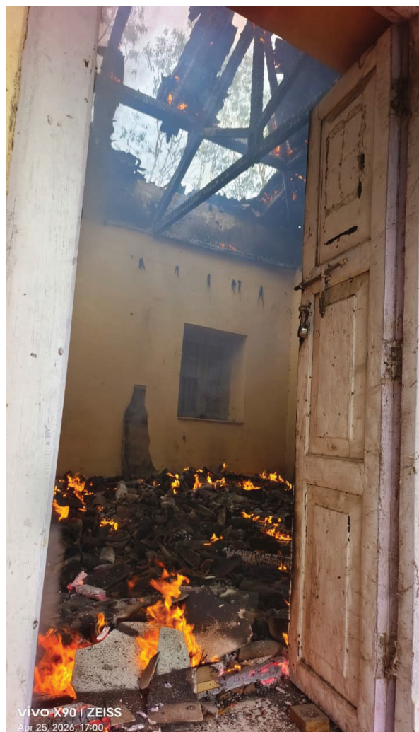
ब्राम्हणवाडा