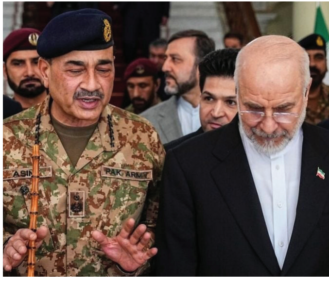
मुंबई : (स. गांवकरी)

अमेरिका आणि इराण यांच्यात अपेक्षित शांतता चर्चेची दुसरी फेरी फिस्कटल्याने दोन्ही देशातील संघर्ष पुन्हा उफाळणार का? याकडे सर्व जगाचे लक्ष लागले आहे. चर्चेची पहिली फेरी निष्फळ ठरल्याने दुसरी फेरी केव्हा होणार याबाबत प्रश्न उपस्थित केले जात असताना, पाकिस्तानची राजधानी इस्लामाबादमध्ये