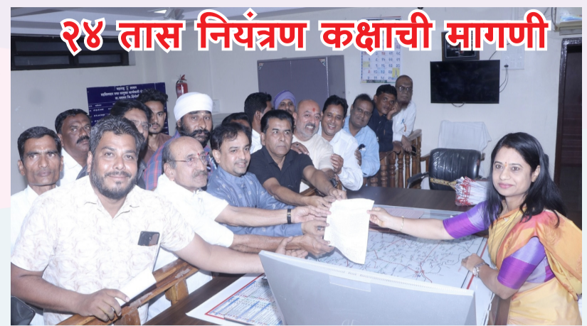
तीव्र आंदोलन छेडण्यात येईल, असा स्पष्ट इशारा नागरिकांनी दिला आहे.