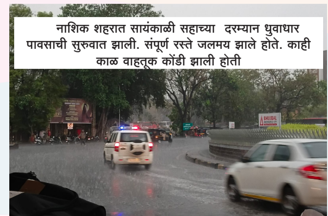
नाशिक शहरात सायंकाळी सहाच्या दरम्यान धुवाधार पावसाची सुरुवात झाली. संपूर्ण रस्ते जलमय झाले होते. काही काळ वाहतूक कोंडी झाली होती