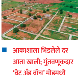
आकाशला भिडलेले दर आता खाली; गुंतवणूकदार 'वेट अँड वॉच' मोडमध्ये

शहर व तालुक्यात गेल्या काही वर्षांत उसळलेल्या प्लॉटिंग बाजाराला आता स्पष्टपणे ब्रेक लागल्याचे चित्र समोर येत आहे. कोरोनानंतरच्या काळात प्रचंड वेगाने वाढलेल्या या व्यवसायात अल्पावधीतच मोठी तेजी आली होती. मात्र आता तीच तेजी ओसरत असून बाजार 'रिअॅलिटी' चेकच्या टप्प्यात पोहोचल्याची चर्चा सुरू आहे.