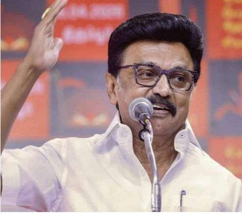
मुंबई

पश्चिम बंगाल इतकंच महत्त्वाचं राज्य आहे तामिळनाडू. इथेही 234 जागांसाठी मतदान पार पडलं आहे. खरंतर, दक्षिणेत राष्ट्रीय पक्षांचं फार अस्तित्व नाही. भाजप, काँग्रेस दोन्ही प्रमुख पक्ष स्थानिक पक्षांच्या मदतीनंच निवडणुका लढत आले आहेत. त्यात स्थानिक पक्षांचा मोठा वाटा राहिला आहे. आता तामिळनाडूमध्ये द्रमुक आणि अण्णा द्रमुक हे दोन मुख्य पक्ष. त्यांचीच सरकार राहिली आहेत. आताही स्टॅलिन यांच्या नेतृत्वात सरकार आहे आणि सलग दुसऱ्यांदा सत्तेत येण्यासाठी स्टॅलिन आणि काँग्रेस आघाडीनं तयारी तर पूर्ण केल्याचं दिसतंय. पण, त्यांच्यासमोर एक नवं आव्हान उभं राहिलंय. त्यामुळेच