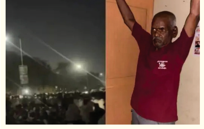
पुणे : (स. गांवकरी)

भोर तालुक्यातील नसरापूर येथील चार वर्षांच्या चिमुकलीवर पाशवी अत्याचार करून तिची निर्घृण हत्या करणाऱ्या नराधम आरोपीला पुणे न्यायालयाने ७ मे पर्यंत पोलिस कोठडी सुनावली आहे. विशेष न्यायाधीश एम. जी. चव्हाण यांच्यासमोर ही सुनावणी पार पडली. सुनावणी दरम्यान आरोपीने स्वतःचा बचाव करण्यासाठी 'भांडणातून