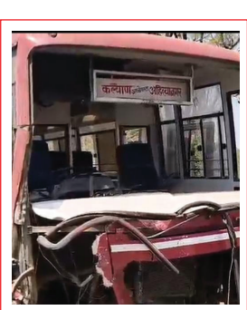
एसटी-स्कॉर्पिओ धडकेत ४ ठार, अनेक जखमी!

वैशाखरे, मुरबाड (स. गांवकरी) मुरबाड-माळशेजघाट महामार्गावर वैशाखरे गावाजवळ आज दुपारी एसटी बस आणि स्कॉर्पिओ यांच्यात भीषण समोरासमोर धडक होऊन झालेल्या अपघातात ४ जणांचा जागीच मृत्यू झाला असून अनेक जण जखमी झाले आहेत. या दुर्घटनेमुळे परिसरात हळहळ व्यक्त होत आहे. प्राथमिक माहितीनुसार, मुरबाडहून माळशेजघाट दिशेने जाणारी एसटी बस आणि समोरून येणारी स्कॉर्पिओ यांच्यात घाट परिसरात जोरदार धडक झाली. अपघाताची तीव्रता इतकी होती की स्कॉर्पिओ वाहनाचा अक्षरशः चककाचूर झाला. धडकेचा आवाज दूरवर ऐकू गेल्याने स्थानिक ग्रामस्थांनी घटनास्थळी धाव घेत बचावकार्य सुरु केले. अपघाताची माहिती मिळताच पोलीस, आपत्कालीन यंत्रणा आणि रुग्णवाहिका घटनास्थळी