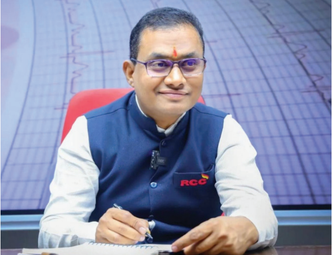
पुणे