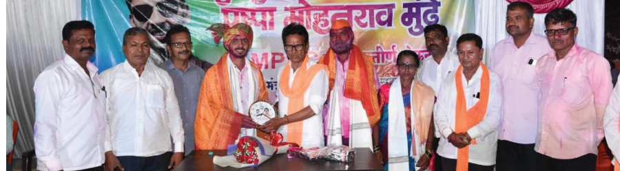
अकोले : (स. गांवकरी) आदिवासी समाजातील मुले प्रतिकूल परिस्थितीत शिक्षण घेऊन यश संपादन करीत आहे ही भूषणावह गोष्ट आहे.

गावाने वाजत गाजत काढली मिरवणूक, आमदारांच्या हस्ते झाला सन्मान